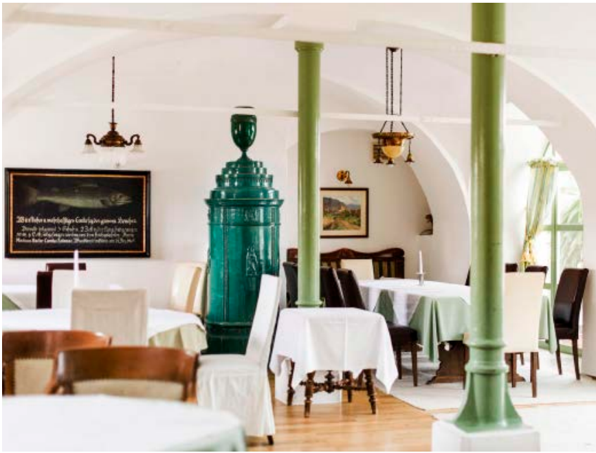
Oben: Ein Blick in den Wintergarten des Restaurants, das als eine der schönsten Gaststätten Österreichs zertifiziert ist. Mitte links: Fritz und Birgit Salomon im Verkostungsraum. Mitte rechts und unten: Die Holzböden in den Zimmern sind teils noch original-erhalten